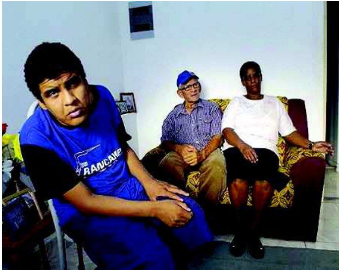
Jovem na casa do pai, que alega não ter como tomar conta

Uma semana depois, no dia 25, o delegado encaminhou um ofício para assistência médica da prefeitura solicitando providência para o atendimento necessário do jovem. 'Entendi o caso como uma necessidade da família e não crime de cárcere privado. É uma situação que exige urgência', afirmou.